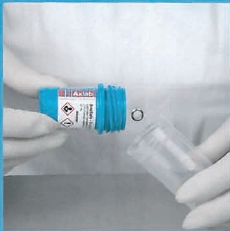
Se desenrosca la tapa.