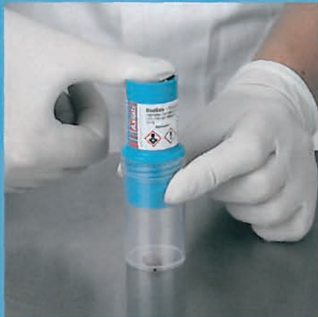
La formalina se libera al presionar la tapa.