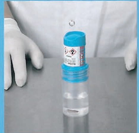
La biopsia está lista para su transporte.