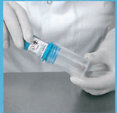
Se enrosca la tapa.