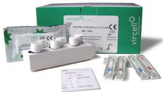
Ref. VR002 25 tests