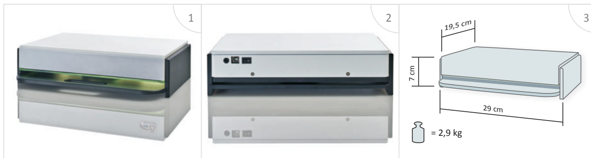
Imagen 1: Unidad cerrada