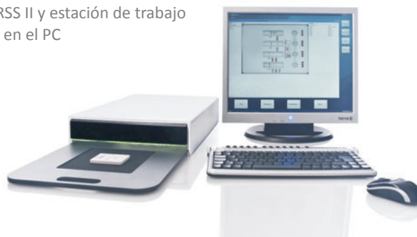
Imagen 4: Scanner RSS II y estación de trabajo instalada en el PC